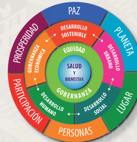
Componentes de la Fase VII

La Fase VII afirma que el desarrollo equitativo y sostenible de las ciudades y la prosperidad comunitaria de las poblaciones urbanas depende de nuestra voluntad y capacidad para aprovechar las nuevas oportunidades de mejorar la salud y el bienestar de las generaciones presentes y futuras.